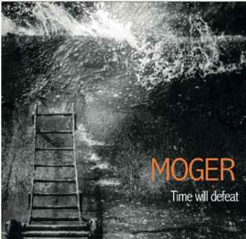
MOGER - TIME WILL DEFEAT ALBUM SORTI EN 2015