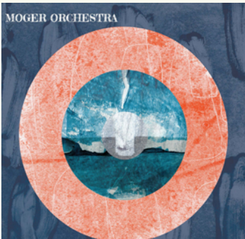
MOGER ORCHESTRA ALBUM & VINYLE SORTIS EN 2017