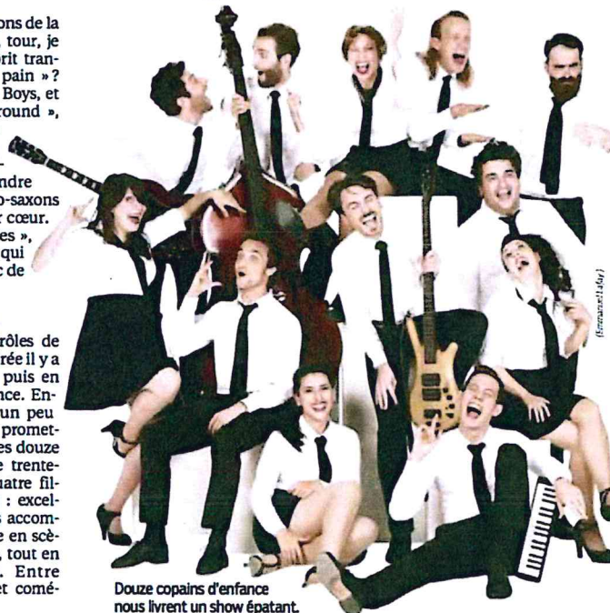
Douze copains d'enfance nous livrent un show épataant.

On avait découvert ces drôles de traducteurs en tenue de soirée il y a quatre ans à la Pépinière puis en tournée dans toute la France. Encore amateur à l'époque, un peu bricolo, leur premier essai promettait beaucoup. Cette fois, ces douze copains d'enfance à peine trentenaires — huit garçons, quatre filles — ont franchi un cap : excellents chanteurs, musiciens accomplis, ils déroulent une mise en scène nettement plus aboutie, tout en gardant leur fraîcheur. Entre concert, théâtre, sketches et comédie musicale.