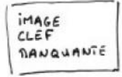
IMAGE CLEF MANQUANTE